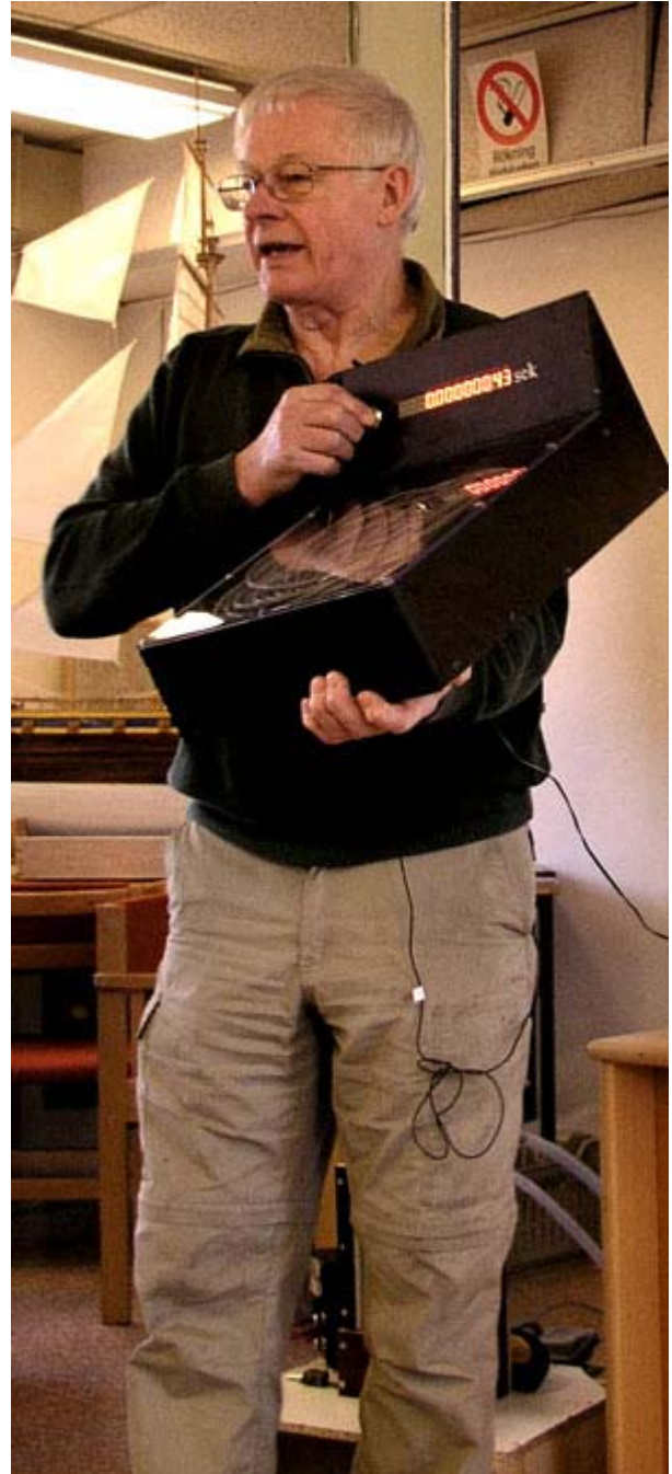
Kunna mäta signalhastigheten i en kabel är inte dumt