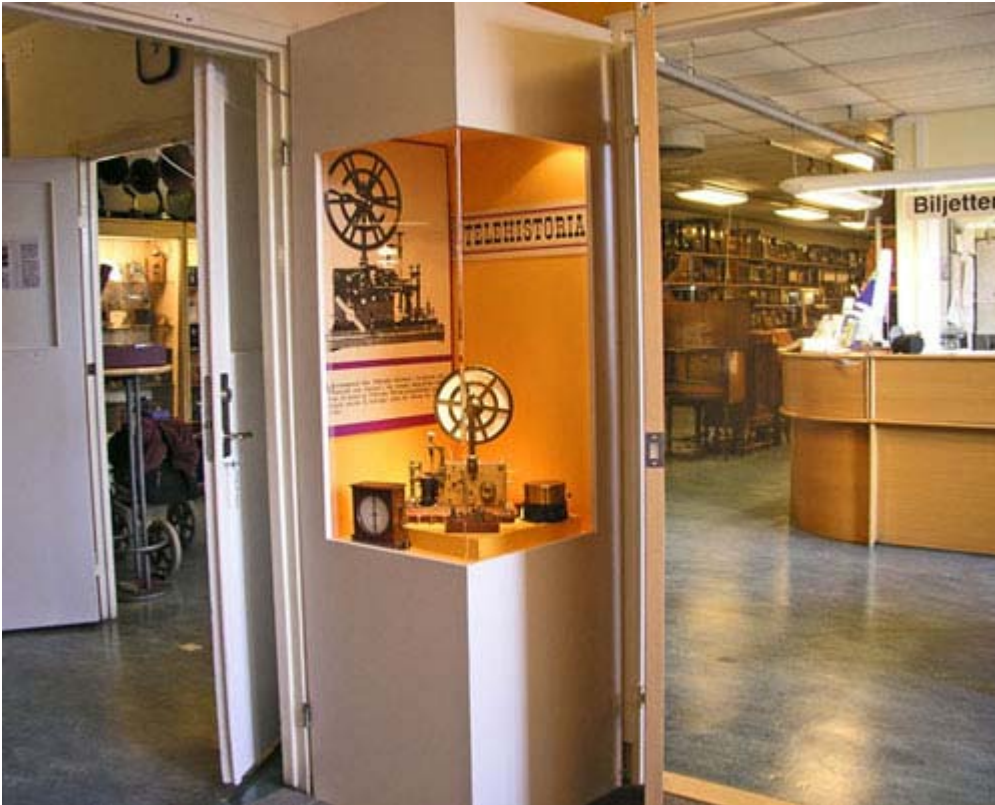
Den nya ingången ger entrén ett luftigt intryck