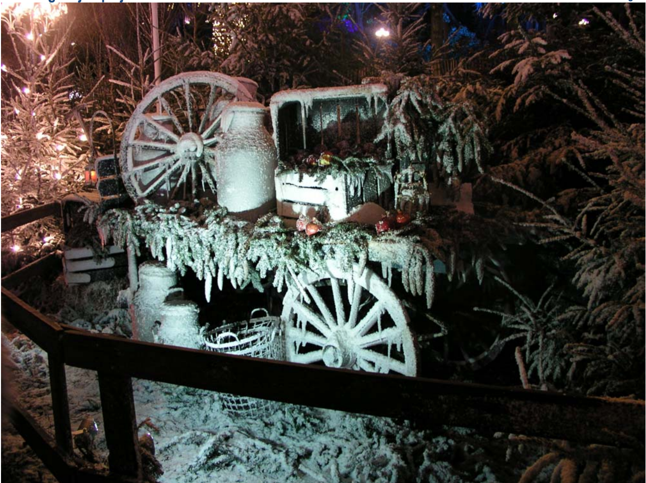
Fantasifullt julangemang på Liseberg 2015