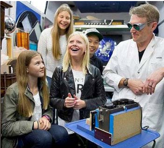
Väcka teknikintresse hos ungdomar är roligt