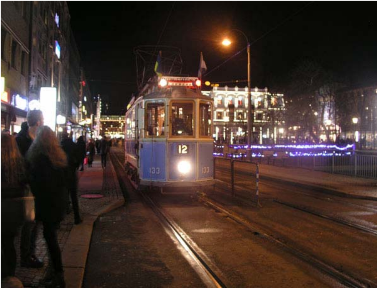
Lisebergslinjen på julutfärd 2015