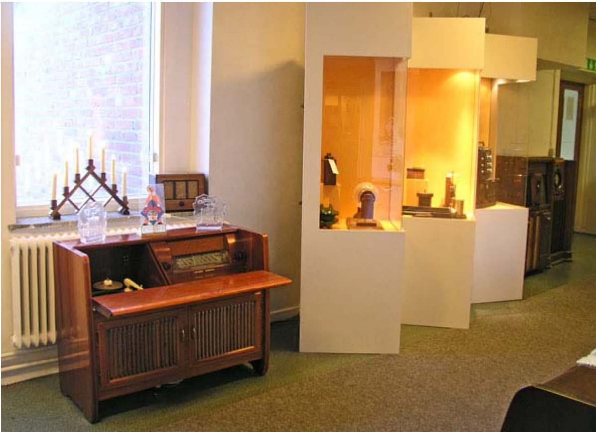
Utställningsskåpen fylls nu med nya föremål