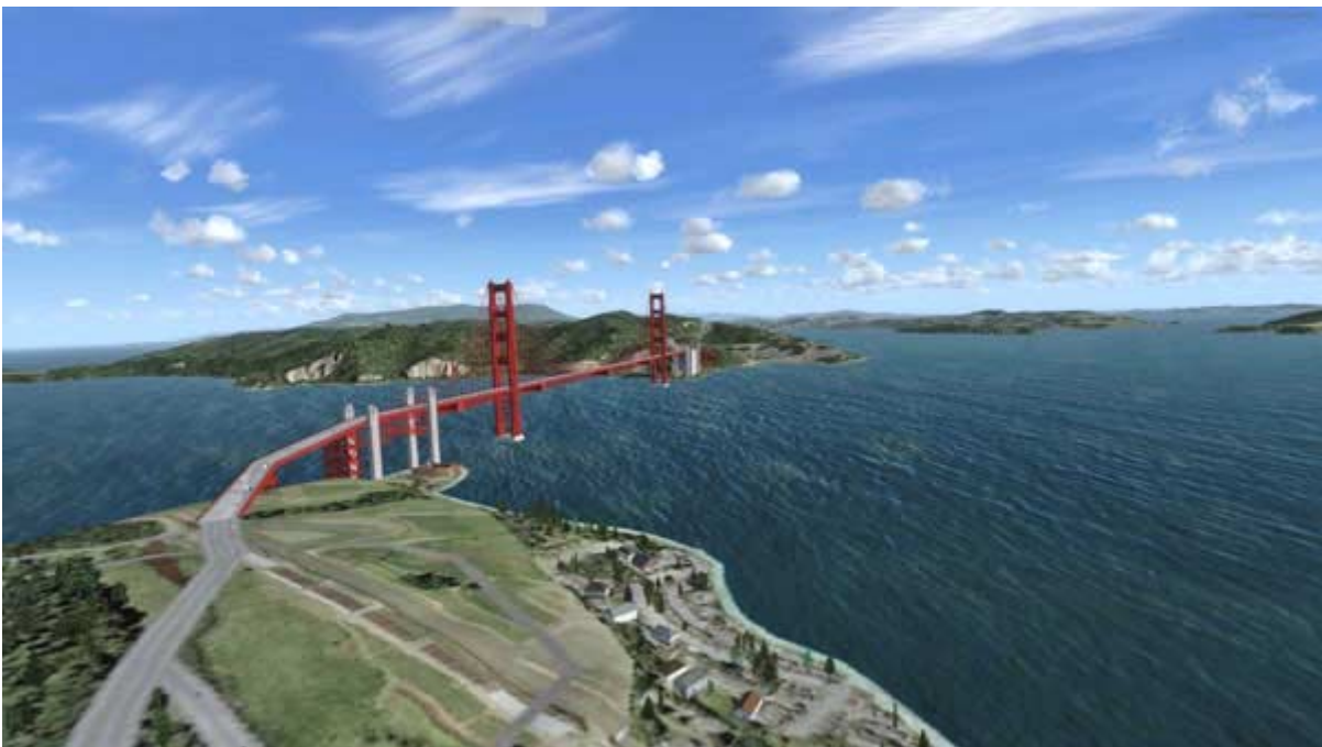
Har för mig detta är Golden Gatebron?