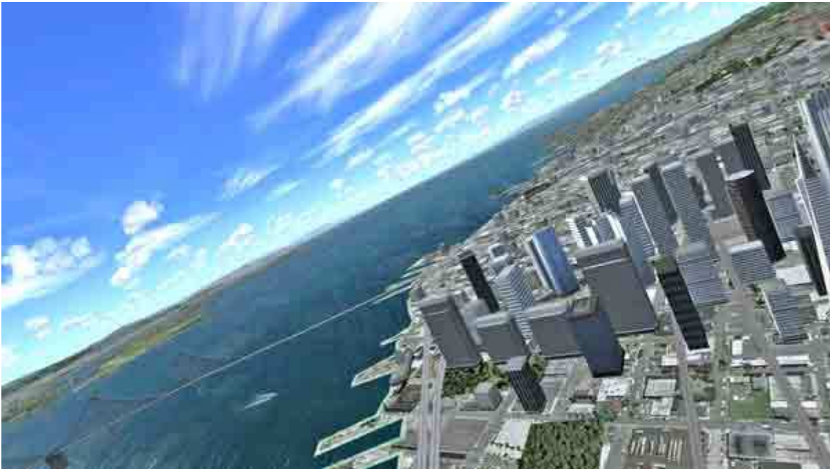
Högersväng in över San Francisco