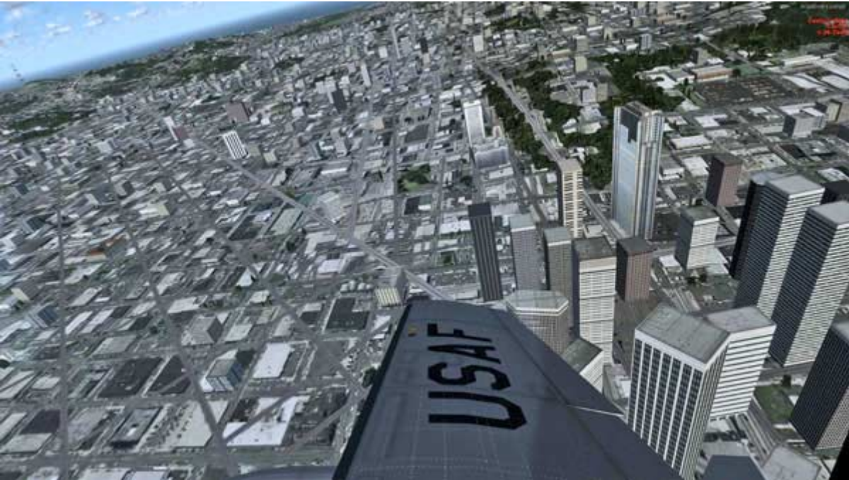
Högersväng in över centrala delarna av San Francisco