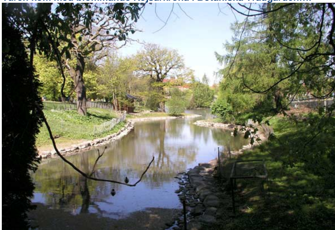
...och lövsprickning i Slottsskogen