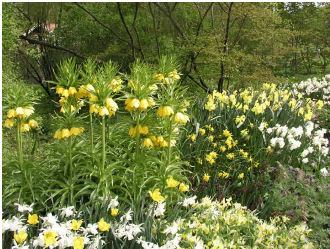
Våren kom med blommande Kejsarkrona i Botaniska Trädgården...