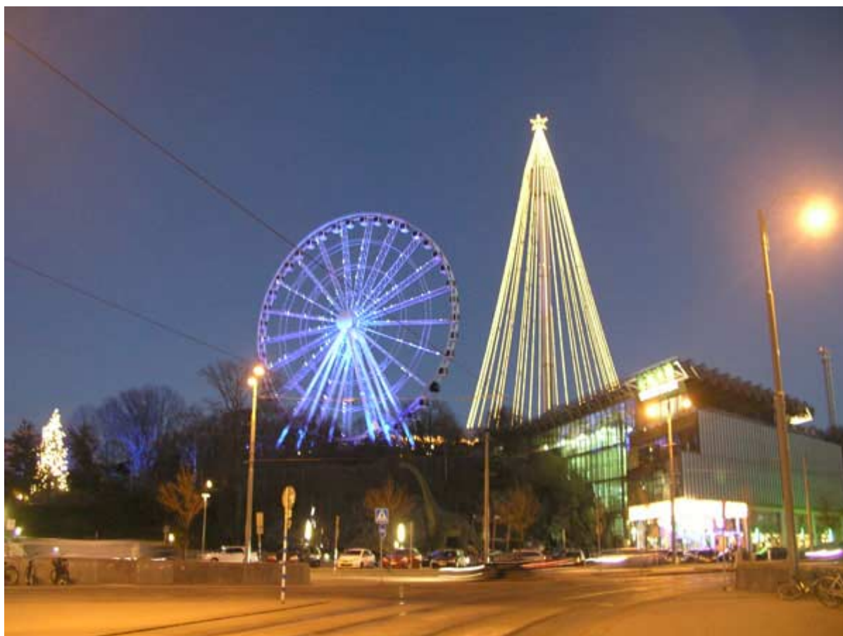
Julstämning på Korsvägen i Göteborg