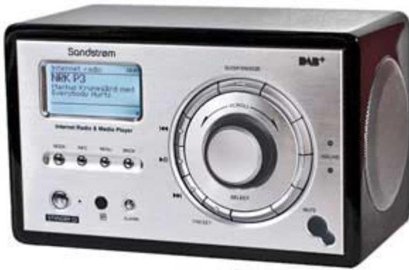
Sandström S2 DAB B11E