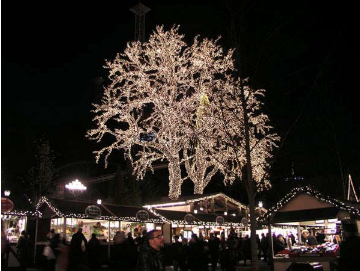
Liseberg är nu julöppet och hälsar alla välkommen till Göteborg