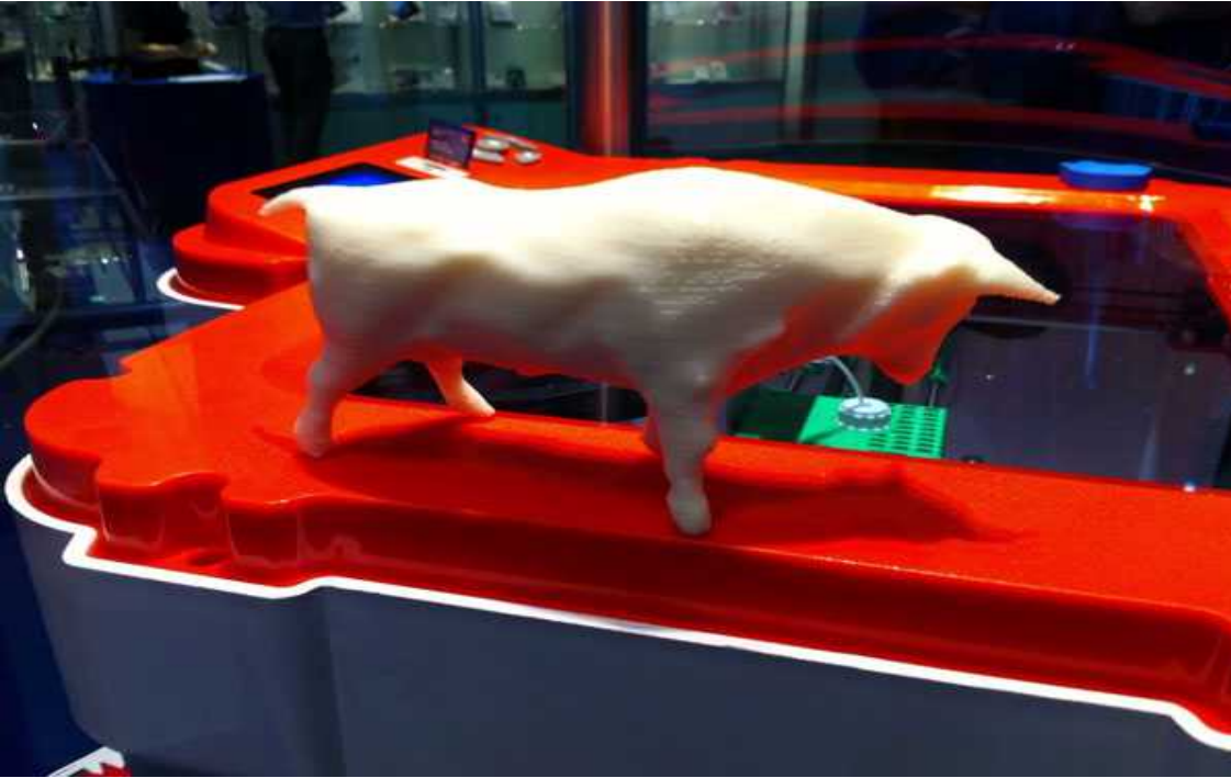
Bild 3. Här är ett exempel på utskrift från en 3D-printer. Varje lager i utskriften är 0,15 mm så man bör nog ha god tid på sig för att ”skriva” ovanstående tjur.