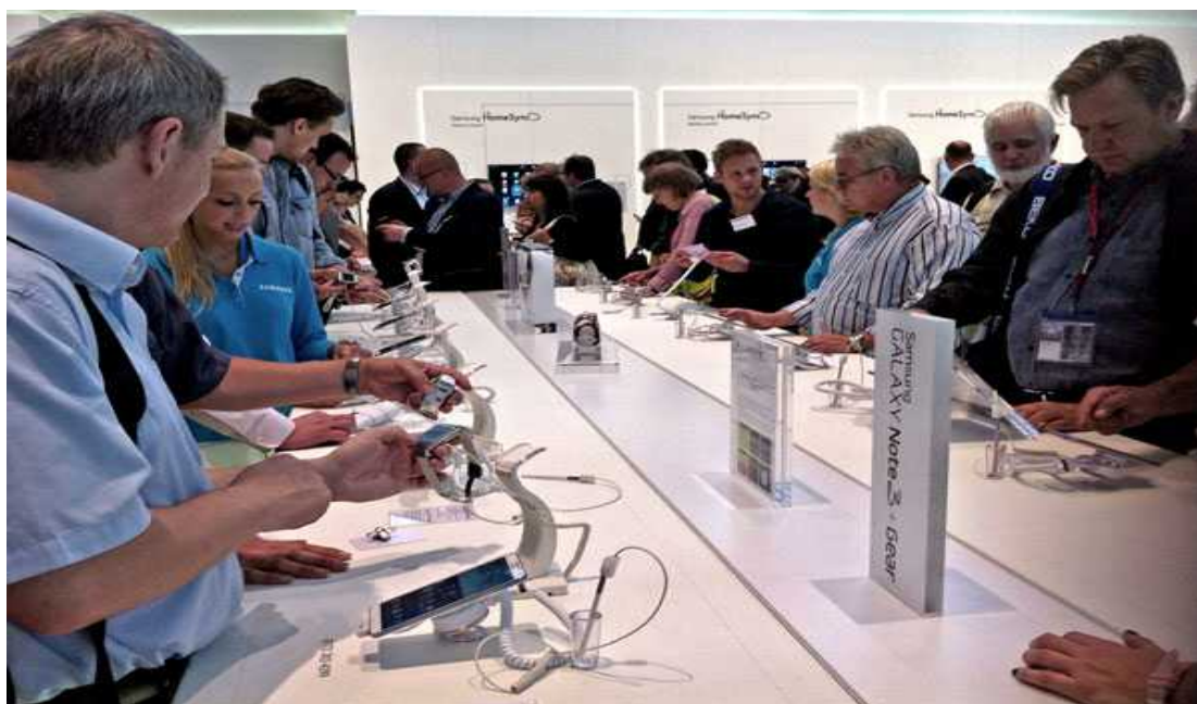
Bild 2. Ett av borden där Samsung Galaxy Gear provades. Intresset för prylen var enormt!