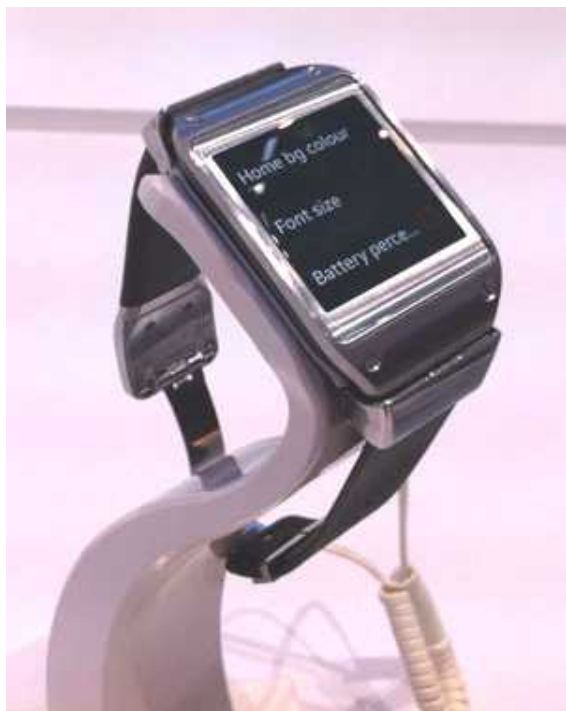
Bild 1. Samsung Galaxy Gear är en av flera s k smart watch. För mer information om denna och flera andra se PC för Alla nr 9, okt 2013 sid 40.