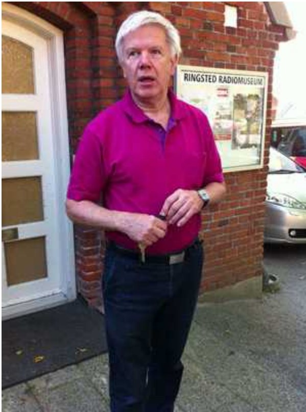
Bilder Kjell Markström