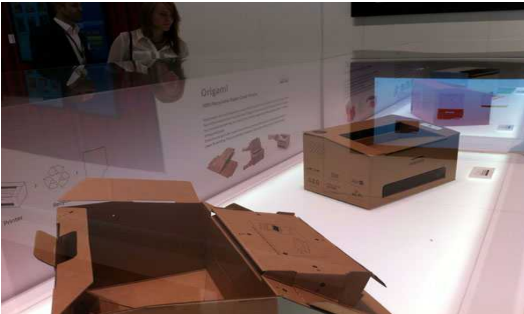
Bild 4. Samsung presenterade sin miljömedvetenhet med att visa skrivare tillverkade av kartong!