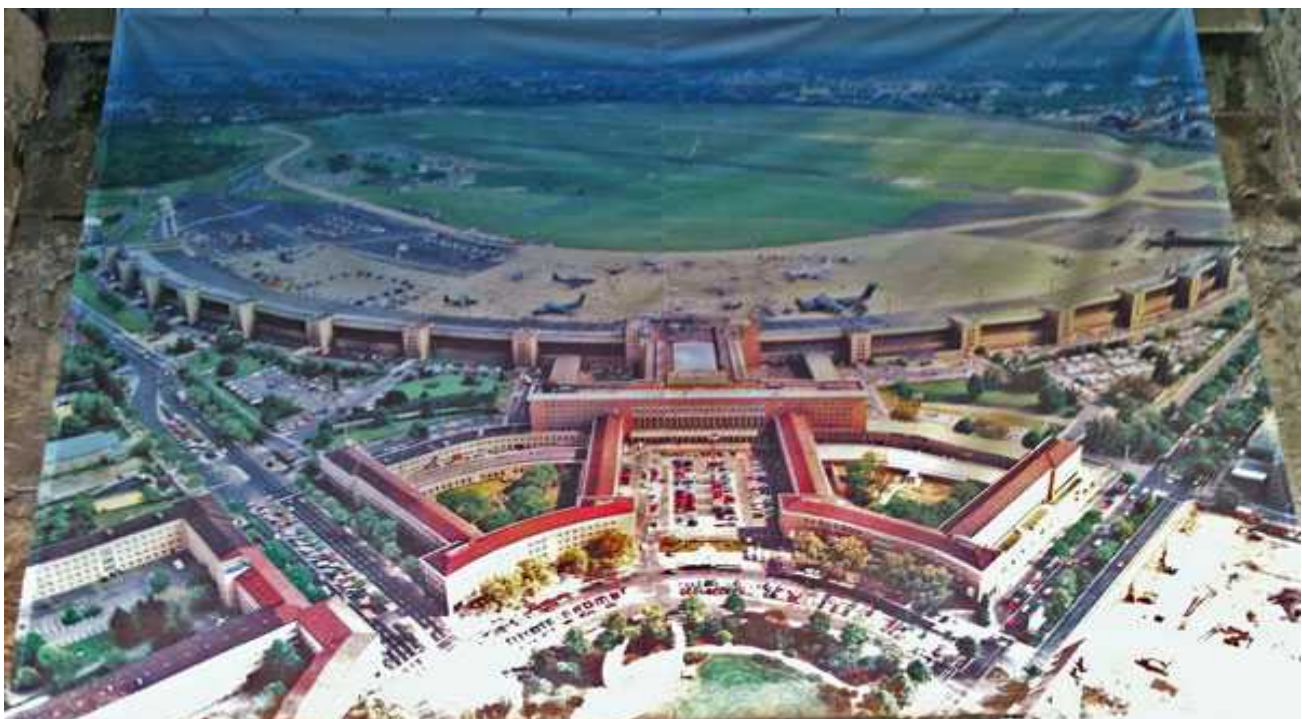
Bild 6. Den nu nerlagda flygplatsen Tempelhof med sina imponerande byggnader från 30-talet.

Som vanligt fanns Fraunhofer med samverkande universitet på mässan med sina utredningar och förslag om framtida system för TV och radio (eller bild och ljud). T ex högupplöst ljud (vad det nu är) och en White Book - Beyond HD. Här presenterades även HDMI 2.0 med fyra gånger så hög upplösning jämfört med dagens HDMI och mycket annat som finns med i denna övergång, se mer på www.hdmiforum.org .