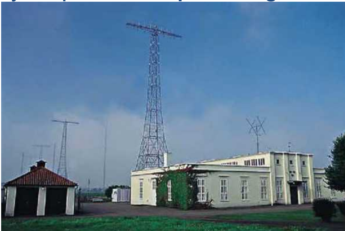
Radiostationen i Grimeton