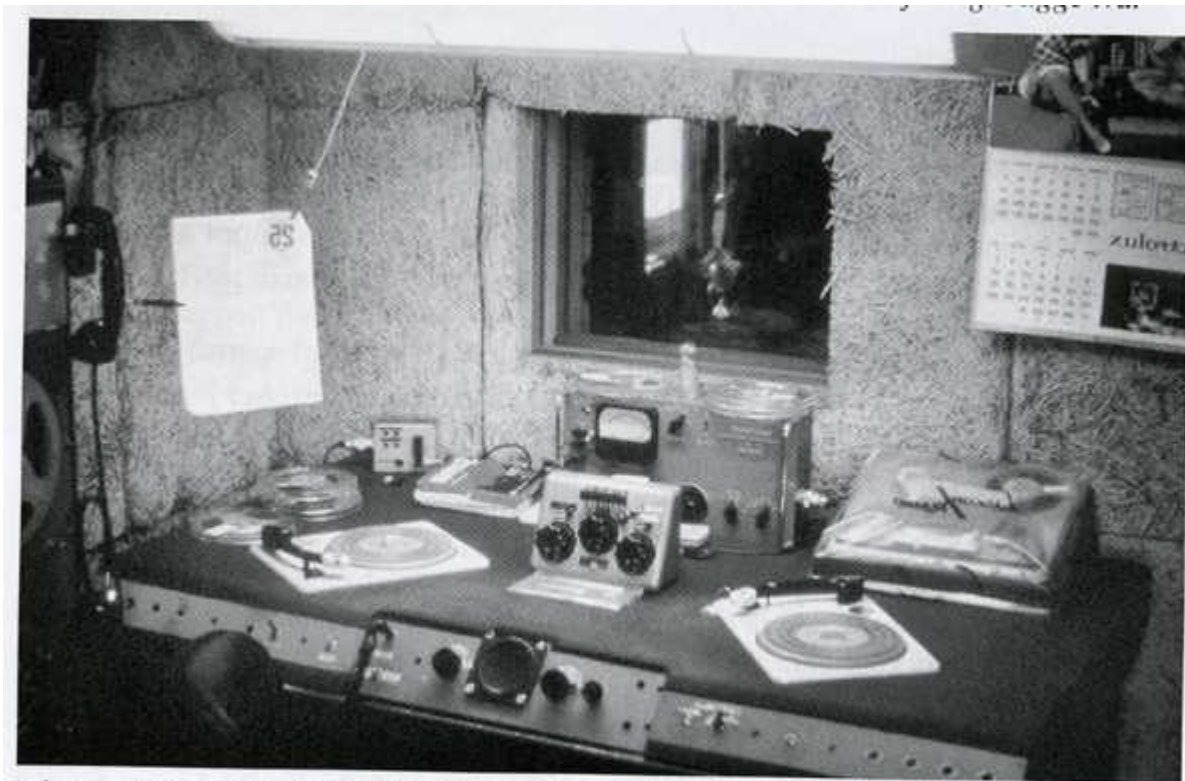
På Kamina skapades 1962 "Radio Kamina" som hade en komplett radiostudio med utrustning bland annat donerad av Sveriges Radio. (Bror Björk)