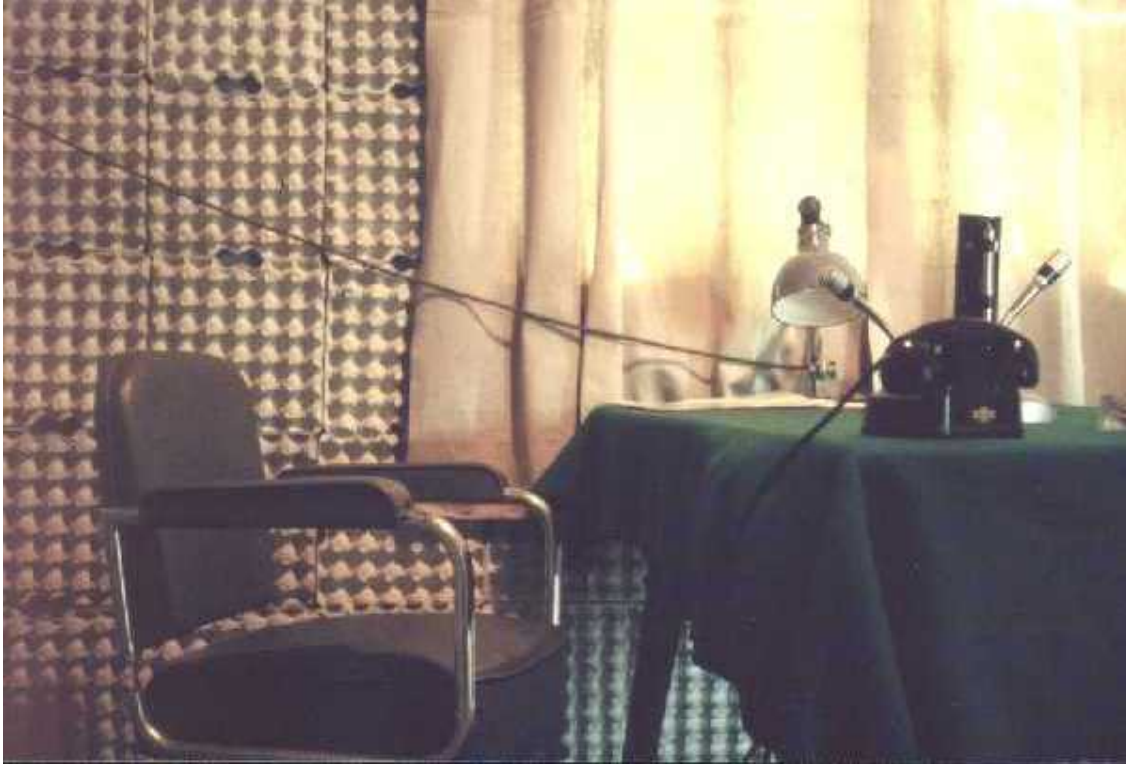
En bild från själva studion.