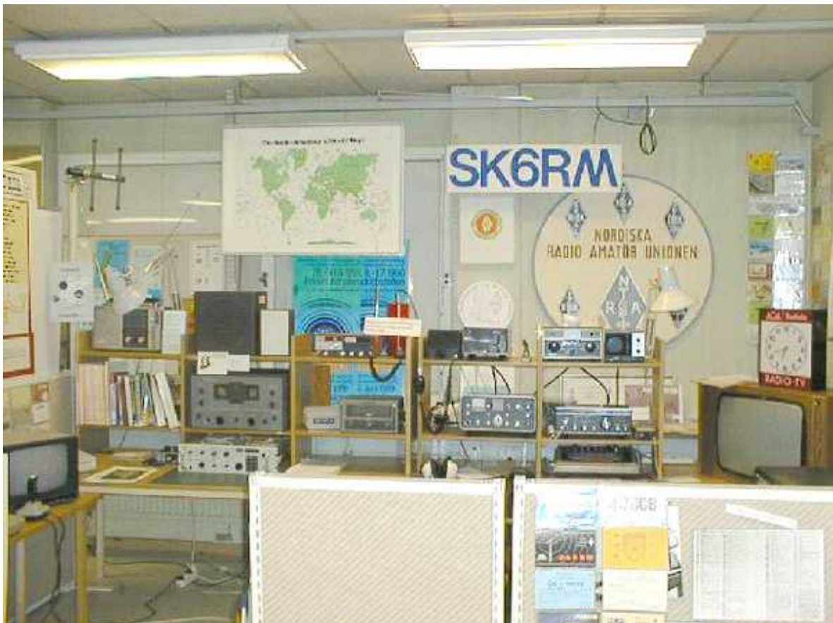
Amatörradio och TV