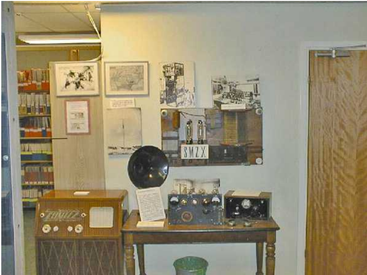
Var är denna bild tagen på museet?