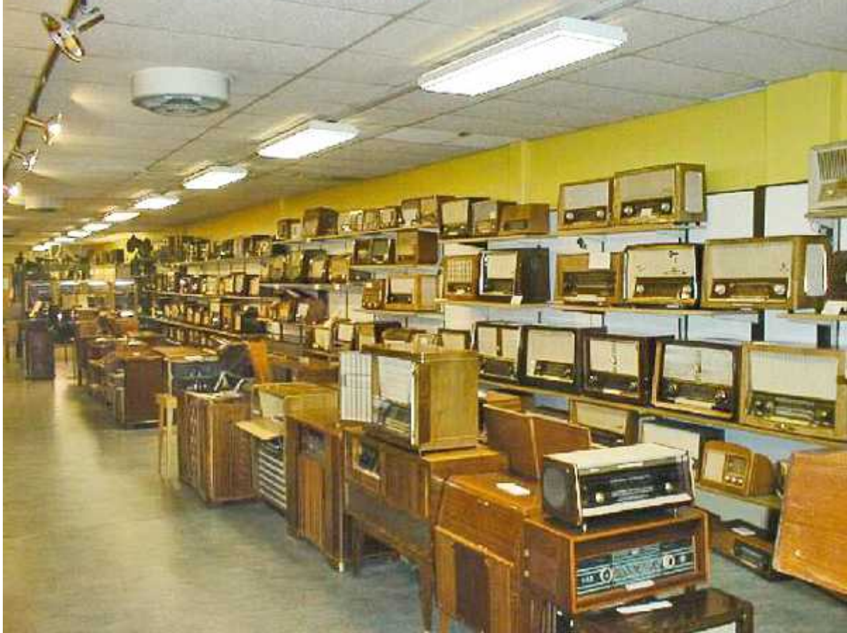
Rundradiodelen mot ingången