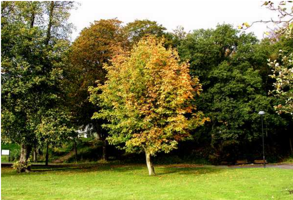
Höstfärger i Slottsskogen