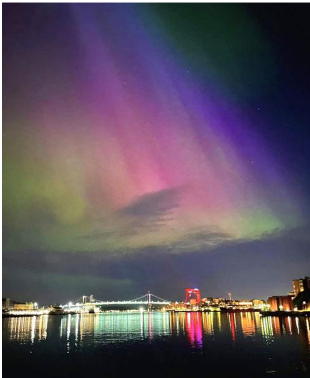
Norrsken över Göteborg 14 maj 2024