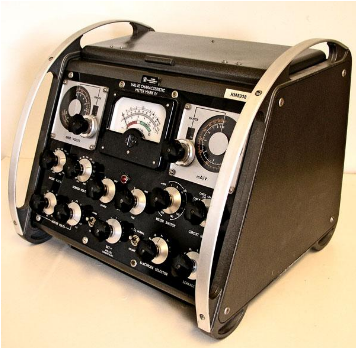
RM 5938 Valve Characteristic meter MARK IV

Denna rörprovare är försvunnen från Radiomuseets verkstad. Den lånades ut av personal vid Radiomuseet för över ett halvår sedan. Den är märkt RM5938 och typ MK4. Vi behöver enheten för kontroll av radiorör i samband med leveranser. Vänligen kontakta Radiomuseet via mail info@radiomuseet.se eller telefon 031-779 21 01.