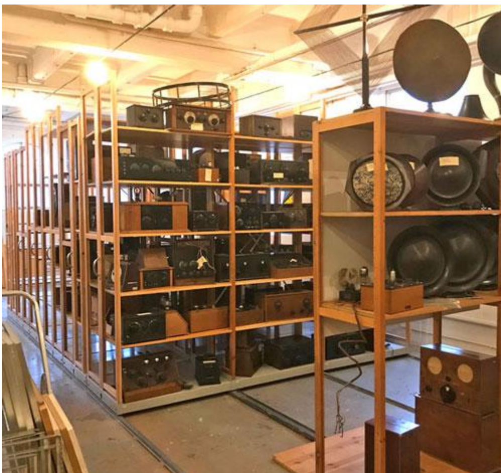
Det stora rullhyllsystemet är nu på plats i studiemagasinet på Industrimuseet i Norrahammar, november 2020