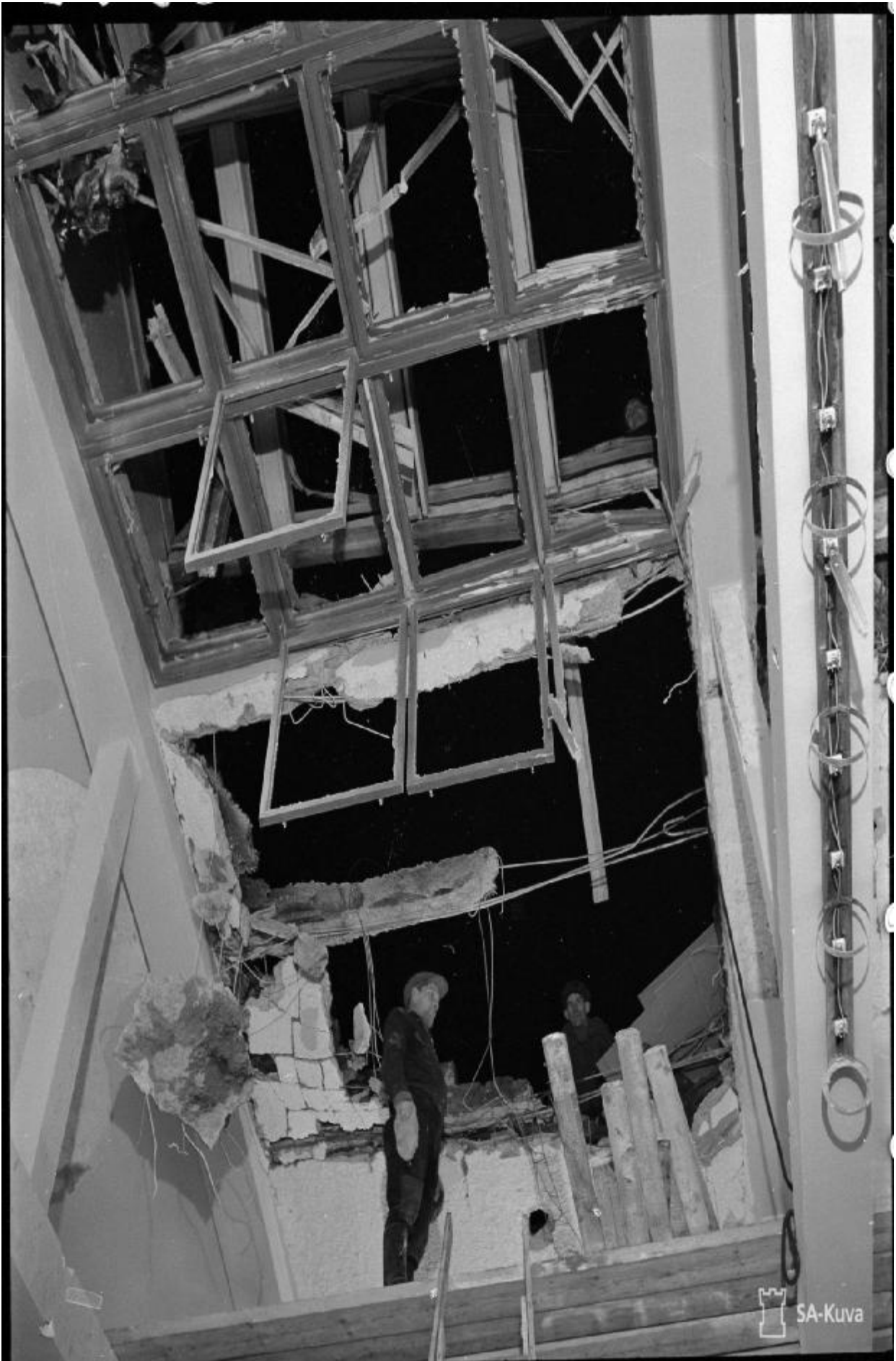
Förödelsen på sändarsalen i Lahtis långvågsstation efter det sovjetiska bombangreppet.