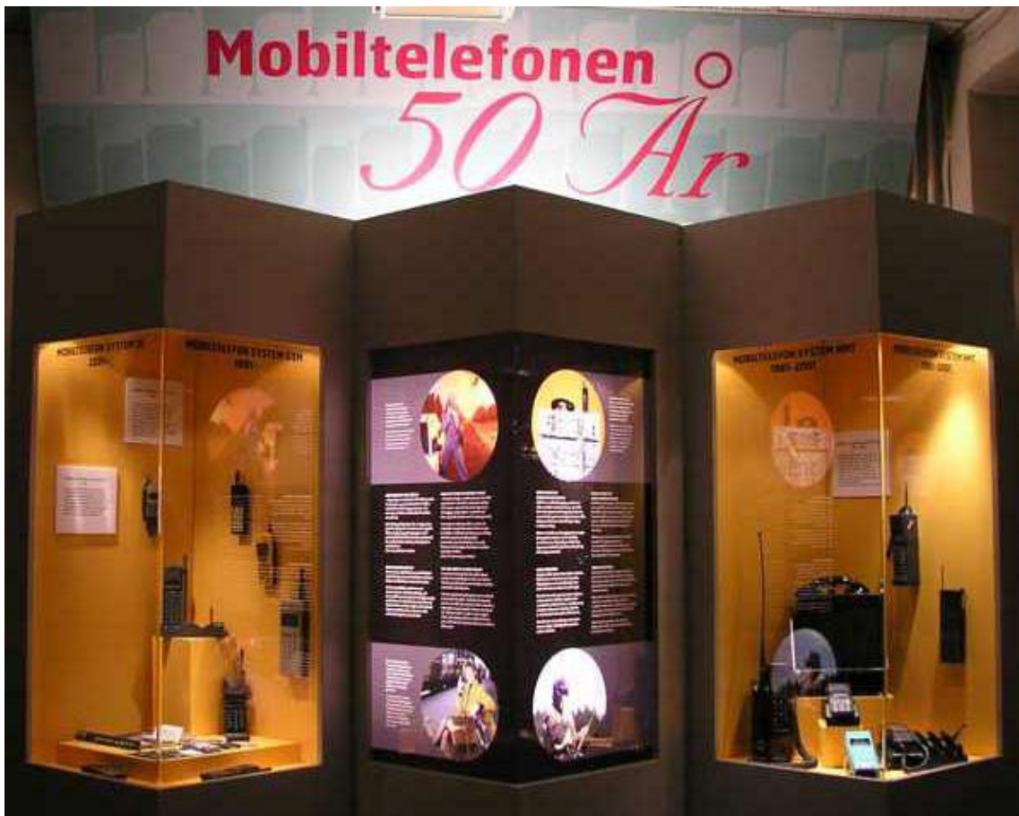
I entrén till Radiomuseet möttes besökaren av de sex ljusskåp som visade Åkes utställning om mobiltelefonens utveckling från 1960 till 2010. ( NfR nr 14 april 2010)