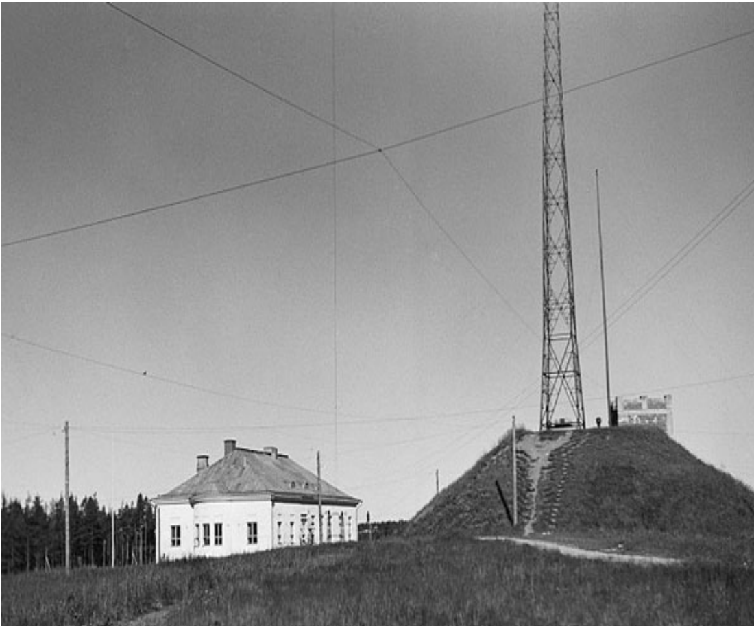
Lahtis långvågstation 1928