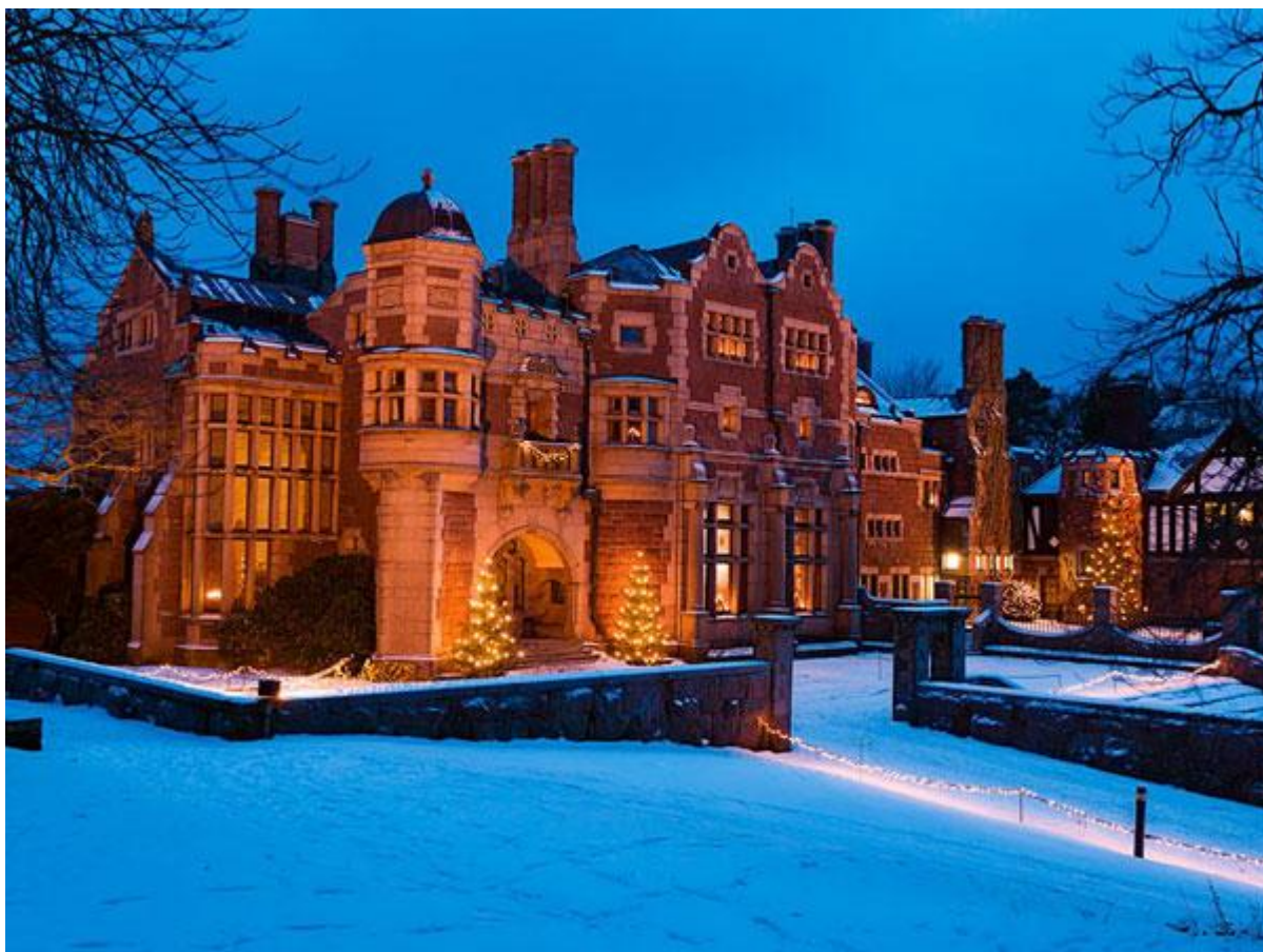
Tjolöholms slott i juletid.