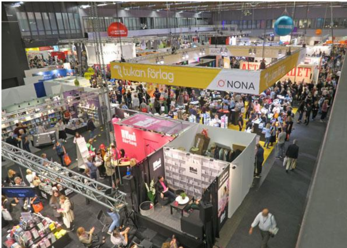
Bokmässan 2019 med 86 000 besökare