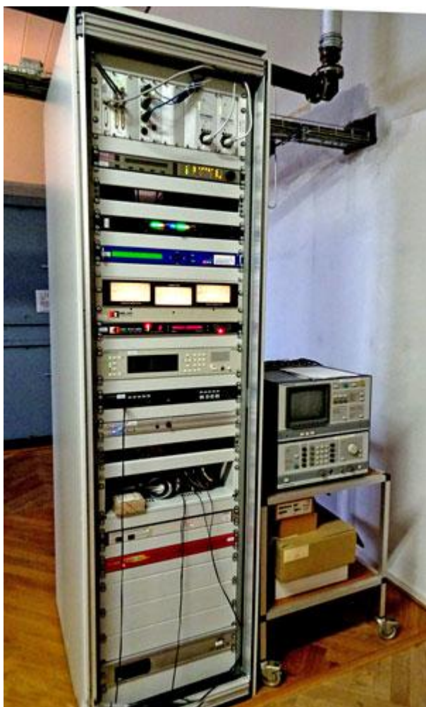
Den nya LV-sändaren från Nautel