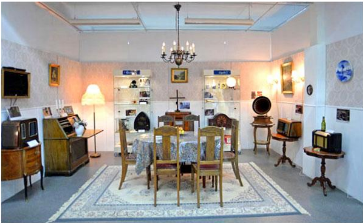
Korsbæks vardagsrum är utrustat med radiomodeller som används i Matadorserien.

Verksamheten och driften av Radiomuseet i Ringsted är ganska lik vår. Museet i Ringsted har ett helt eget hus till förfogande som är vackert och centralt beläget. På första våningen har man sin utställning som är propert och pedagogiskt ordnad med snygga och välbelysta montrar. Montrarna har olika tema med tyngdpunkten på radio, TV och en del teknikhistorik. Fartygsradio, kommunikationsradio och audio är mer sparsamt presenterad medan telefoniområdet inte är representerat. Då Danmark har haft ett stort antal större och mindre radiofabriker och många TV-märken samlar man mestadels danska modeller.