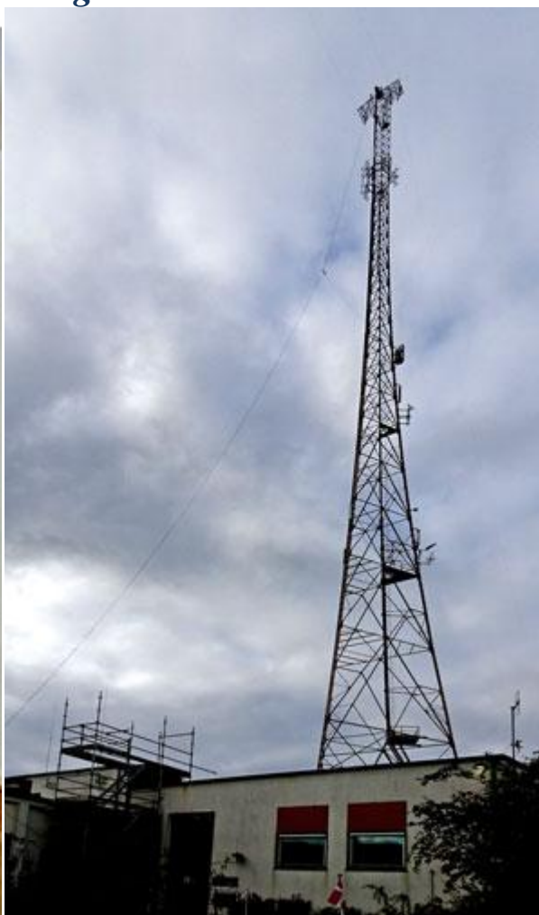
Dagens utformning av sändarmasterna

Nästa dag styrde vi så vår kosa mot Kalundborg där vi sammanträffade med medlemmar från Hörby radioförening. I Kalundborg finns den legendariska långvågsstationen som var huvudstation och grunden för Danmarks statsradiofoni. Stationen byggdes 1927, med ett antensystem inspirerad av långvågsstationen i Grimeton, dock bara två antenntorn. Stationen hade även en mellanvågssändare men den stängdes 2011.