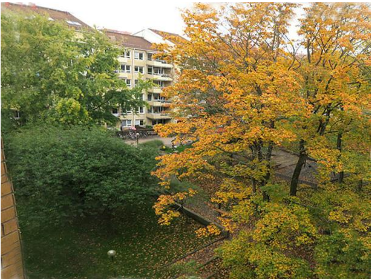
Höstfärger utanför köksfönstret