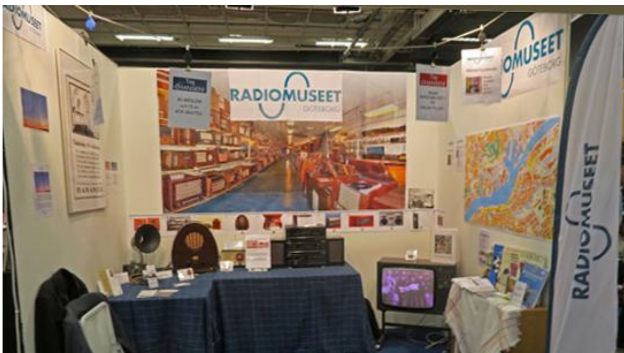
Vår monter på 6 kvm