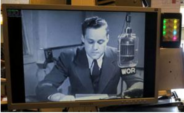
Film 1: Sending Radio Messages (Radiotransmission) Båda från 1940-talet