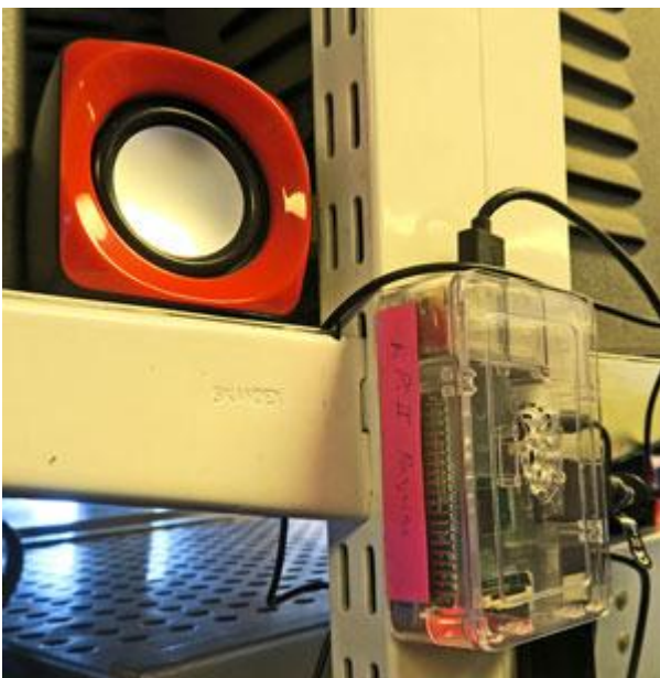
Datorn Raspberry Pi och en av högtalarna