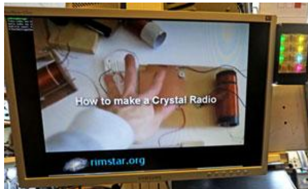
Film 3: Hur man bygger en kristallmottagare