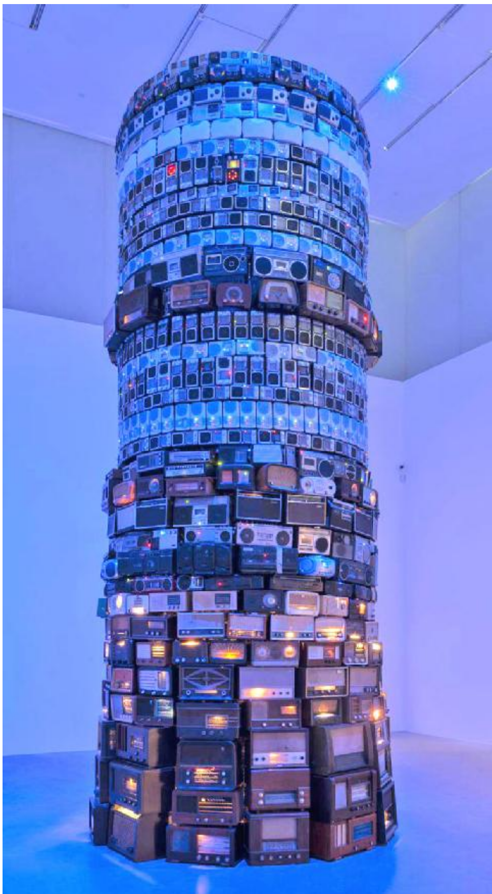
Babel skapat 2001 av Gillo Mezzanotte. (Tate Modern, London)