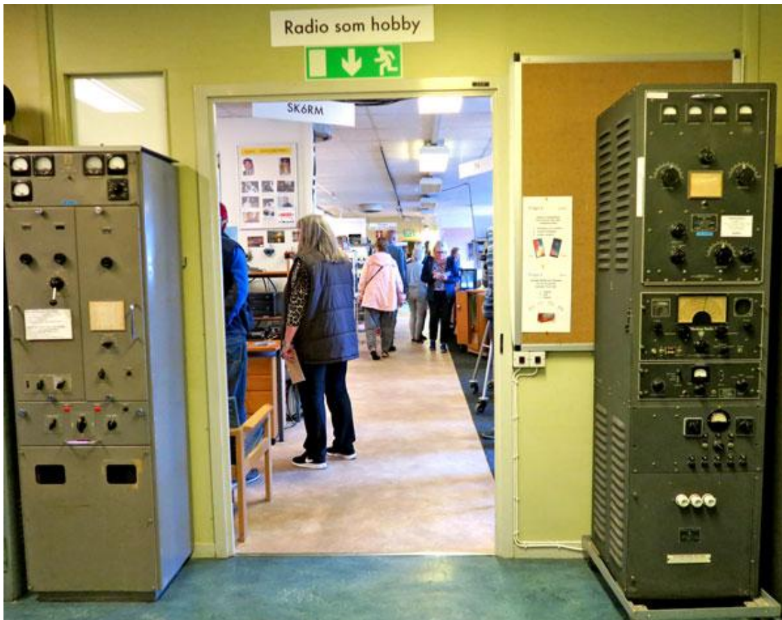
Det var mycket folk på Radiomuseet

Dagen blev en stor succé. Vi hoppades för minst 100 besökare men det kom 274, vilket är i paritet med det högste antalet besökare som Radiomuseet någonsin har noterat som var nära 300 på Öppet Hus i november 2016.