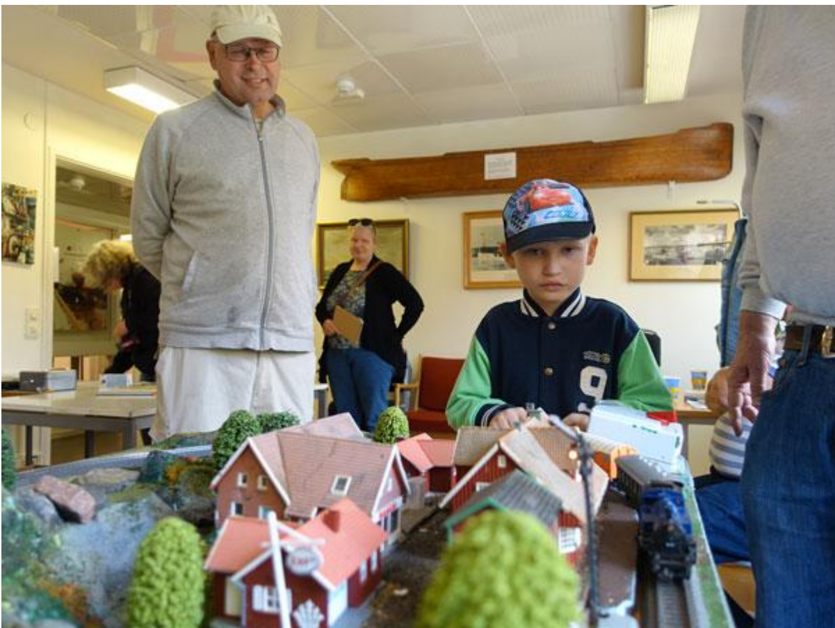
Modelltåg av Spår och Tåg i Väst på Varvshistoriska Föreningen