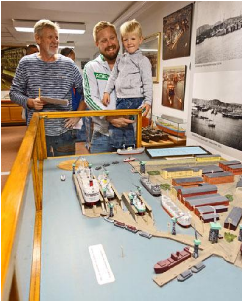
Ett varv beundras på Varvshistoriska föreningen