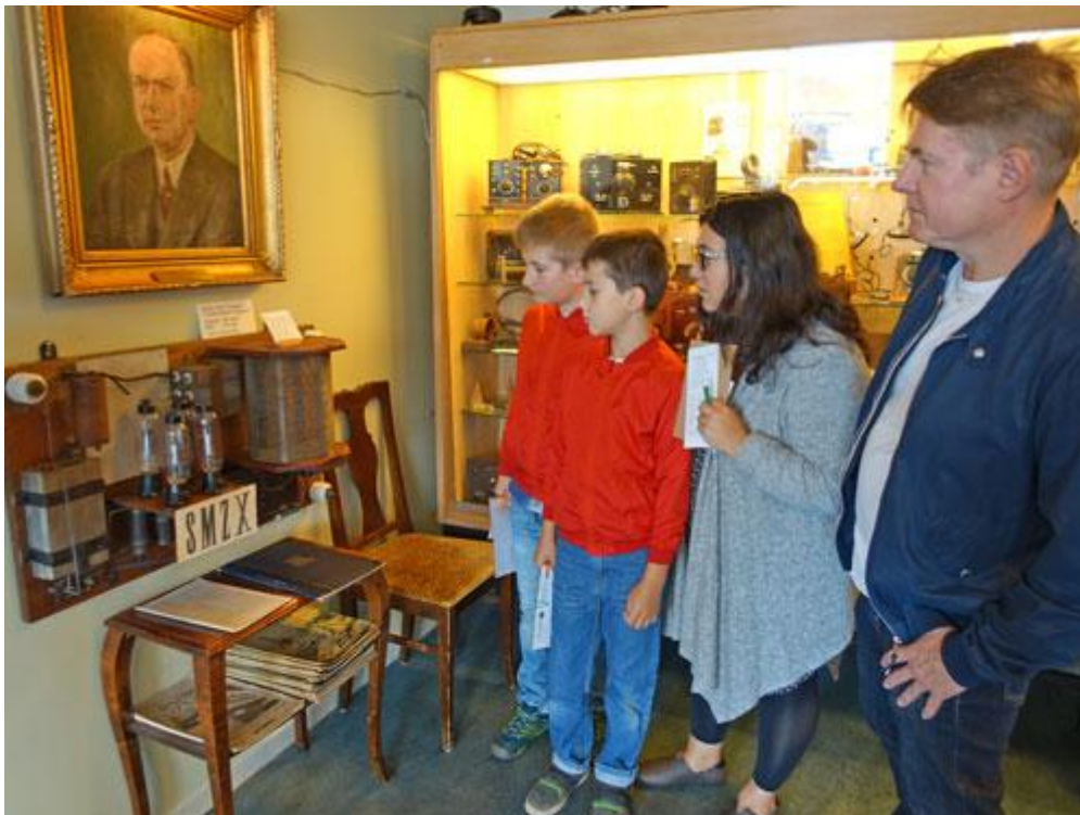
K.G. Eliasons rundradiosändare på Radiomuseet