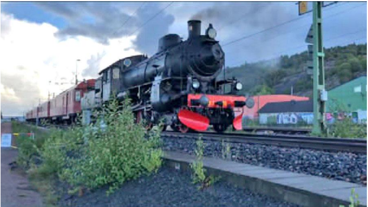
Berslagernas Jänvägssällskap med tåg utefter hamnbanan.

Spår & Tåg i Väst kommer nu att arbeta för att det byggs en enkel hållplats så att man kan stanna vid Götaverkens gamla huvudkontor.