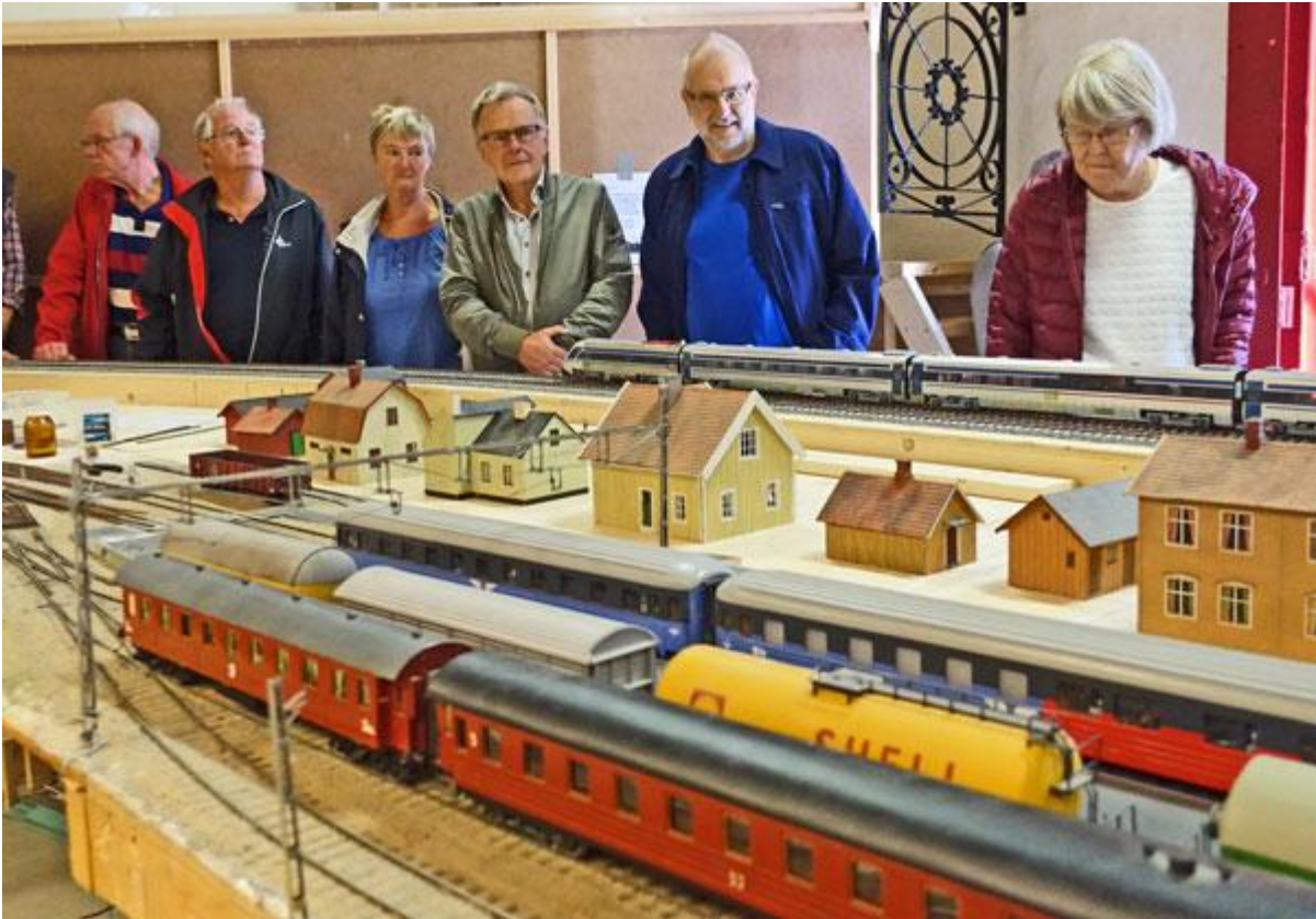
Tåg på Modelljärnvägsföreningen, GMJS