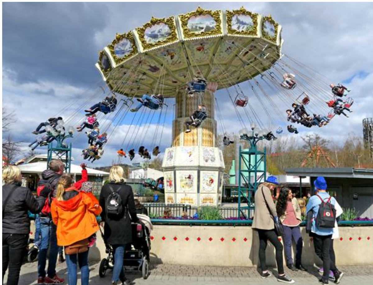
Liseberg har åter öppnat med en gammaldags hederlig karusell och Farfars bilar