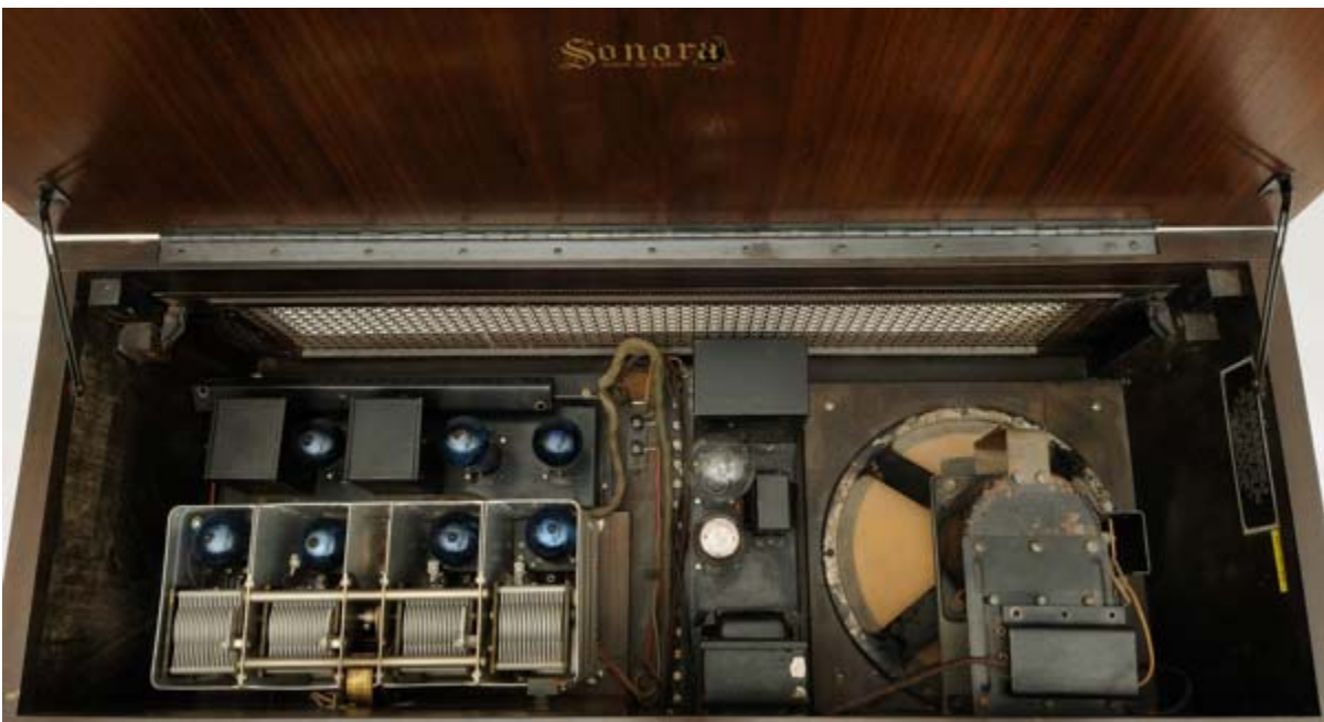
Ett vackert bygge!