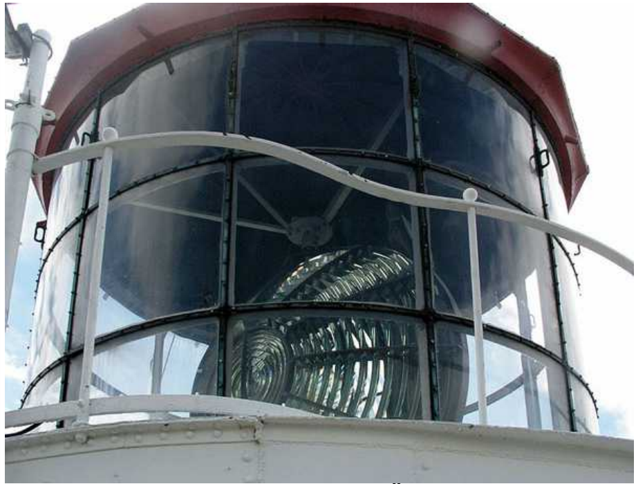
T.v. Heidenstamsfyr T.h. Fresnellinsen på Långe Jan på Öland bygd 1785