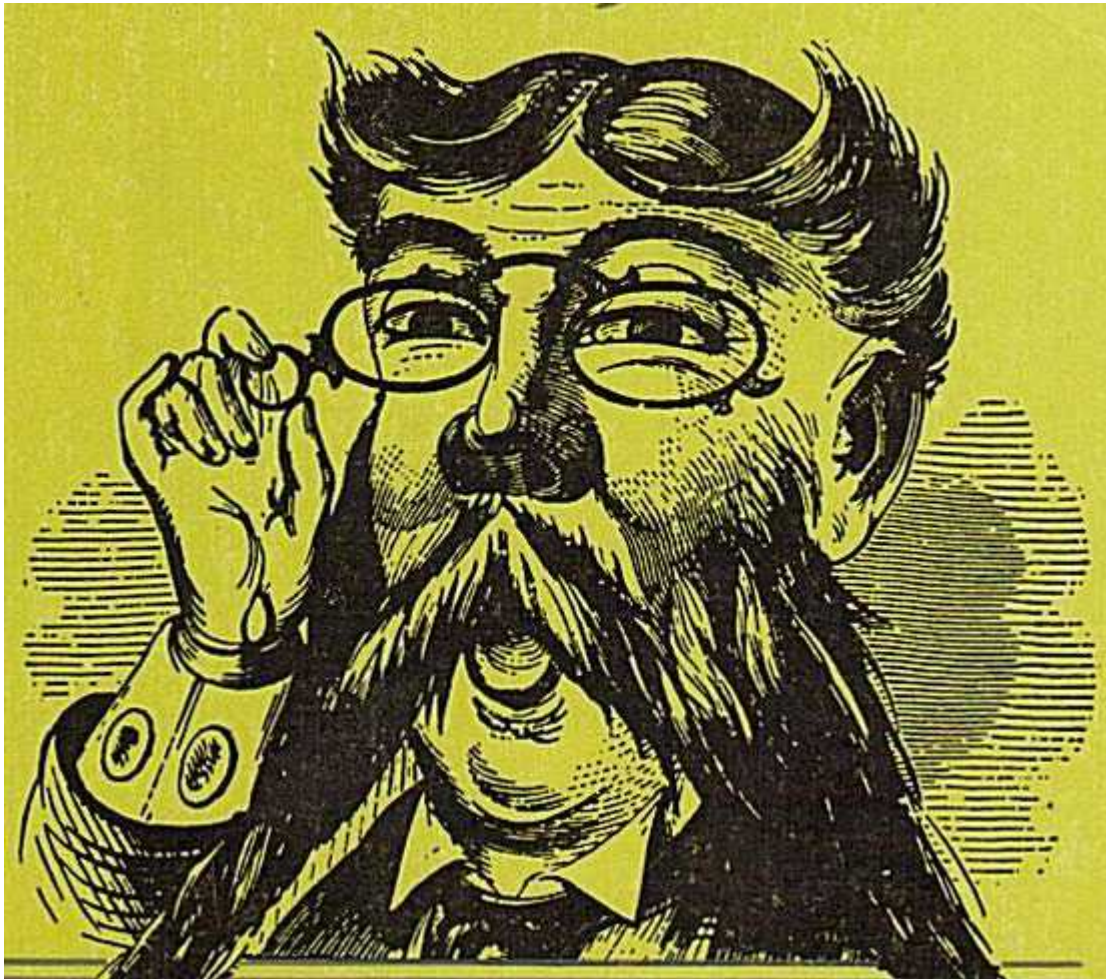
Teckning: Vidar Forsberg

Åskan är ett ämne, som exploderar, när man tänder eld på det. Den slår företrädesvis ned i spetsiga föremål. Därför bör du, när det åskar, i största hast nedgräva alla föremål av metall, som du vet om, sextio mil i jorden. Skulle du dö under arbetet eller skulle åskvädret gå över, innan du slutat, är det bäst att åter gräva upp dem.