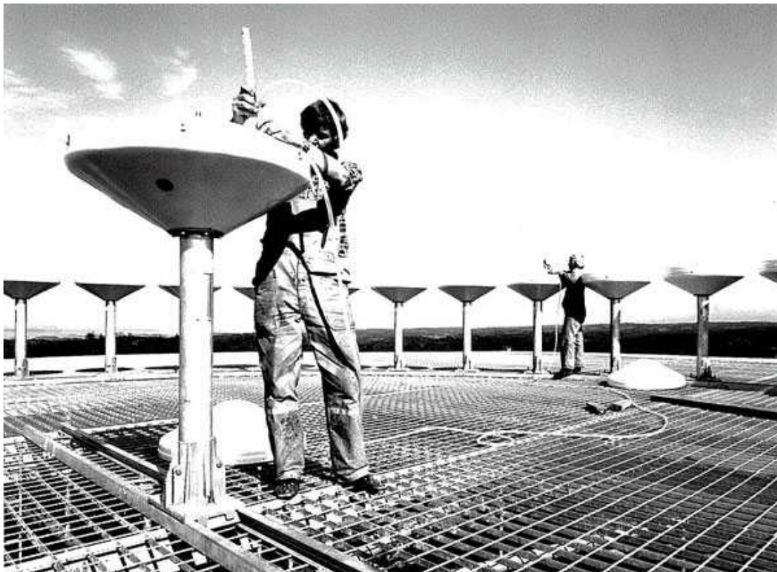
Inmätning av antenner vid en DVOR flygfyr 1976

När det gäller de nya telehjälpmedlen för Landvetter delades de upp efter användningsområde dvs de för flygtrafikledning, de för flygvädertjänsten och de för flygplatstjänsten. Därefter kommer några av de radiotekniska problem som uppstod de första åren på Landvetter att beskrivas. Även telehjälpmedlen utanför flygplatsen kommer att beröras.