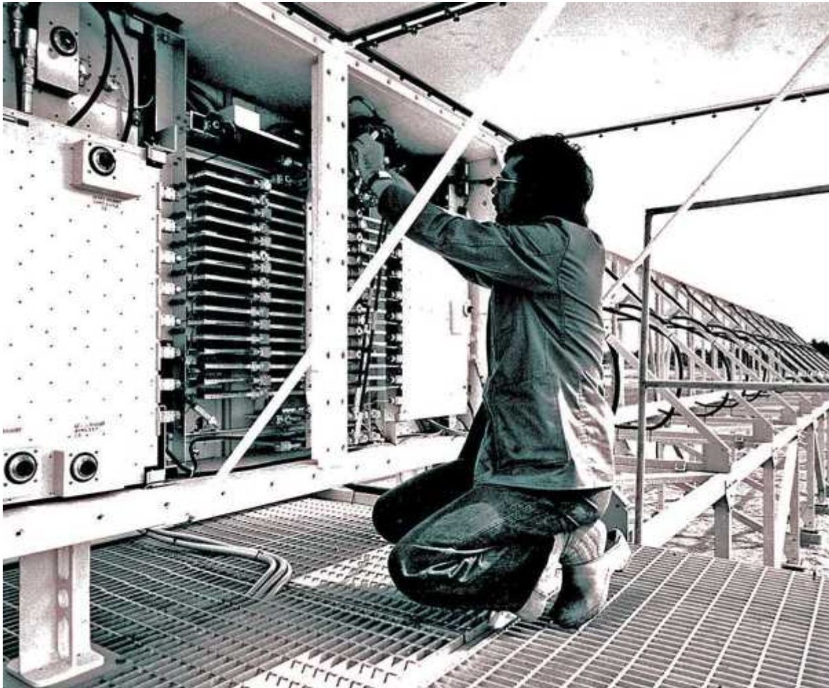
Installation av ILS kurssändarantenn vid Landvetter 1977.