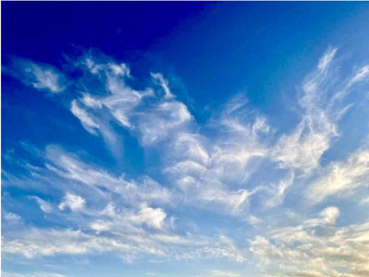
Moln över Köpenhamn