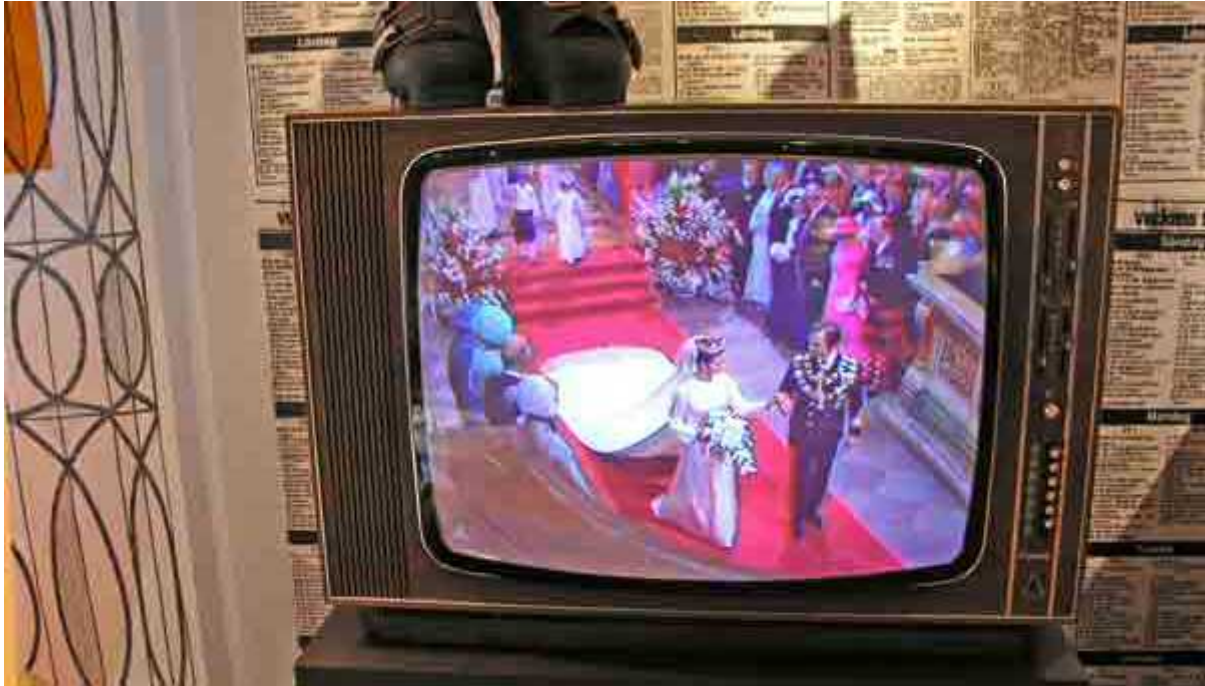
Radiomuseets Luxor Colorama står i centrum i vardagsrummet och visar 70-talsprogram b.l.a. från kungaparets bröllop 1976. Var brudens släp 5 meter långt den gången också?