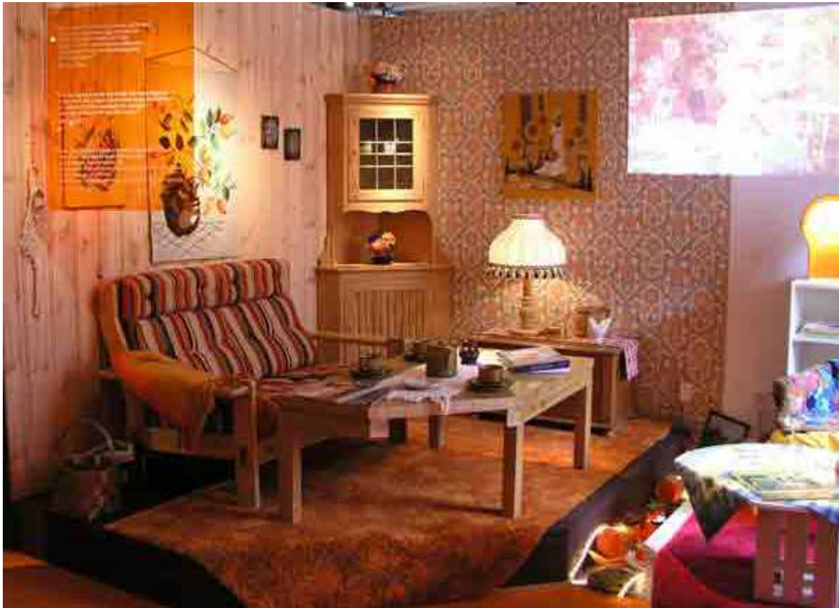
Vardagsrum från 70-talet