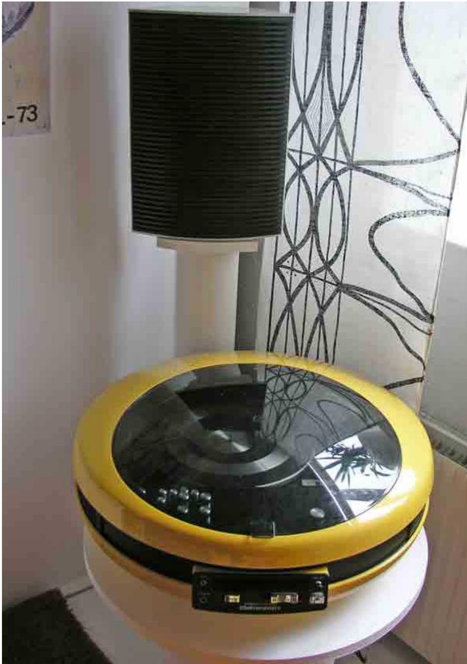
Denna mycket märkliga grammofon finns även att beskåda