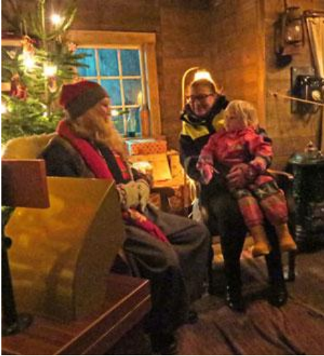
Besök hos tomten