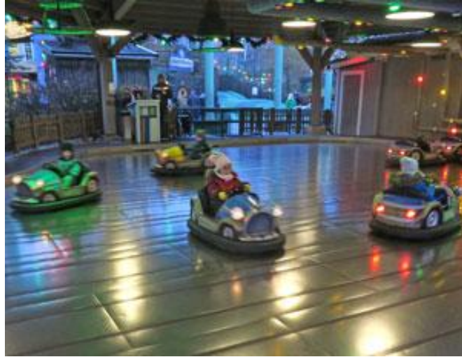
Full fart på bilbanan

För mig har det blivit tradition att besöka Liseberg på julen. Där kan man som besökare få uppleva något som i alla fall liknar snö eftersom det ju är en sällsynt vara här i Göteborg.